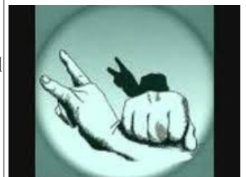
Les Binuchards, signe de reconnaissance