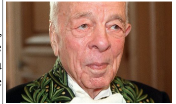
Jean Bernard, Académicien