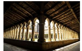
Cloître du Couvent des Carmes